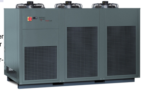
PCGE 1090 (mit Option Sonderfarbe RAL 7043, verkehrsgrau B)