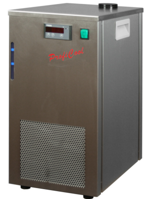
ProfiCool Filius PCFi 06