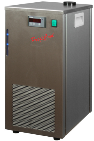
ProfiCool Filius PCFi 20 (Ausführung mit Füßen statt Rollen)