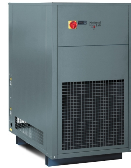
FlowCool Unicus (mit Option Farbe RAL 7043 - verkehrsgrau B)